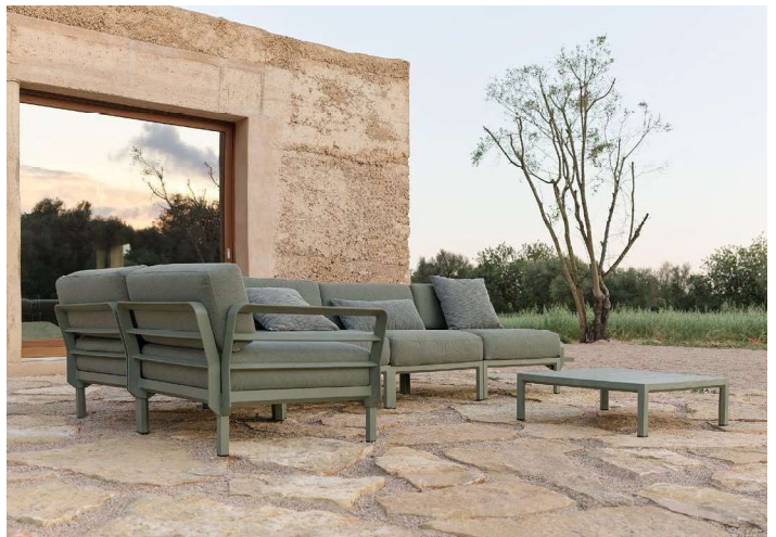
MAXIMO cactus / timo Sunbrella® _ MAXIMO TAVOLINO cactus