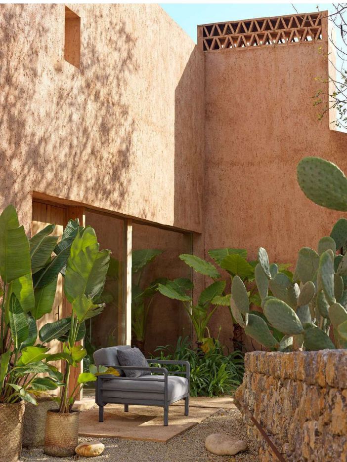
MAXIMO POLTRONA basalto / lava Sunbrella®