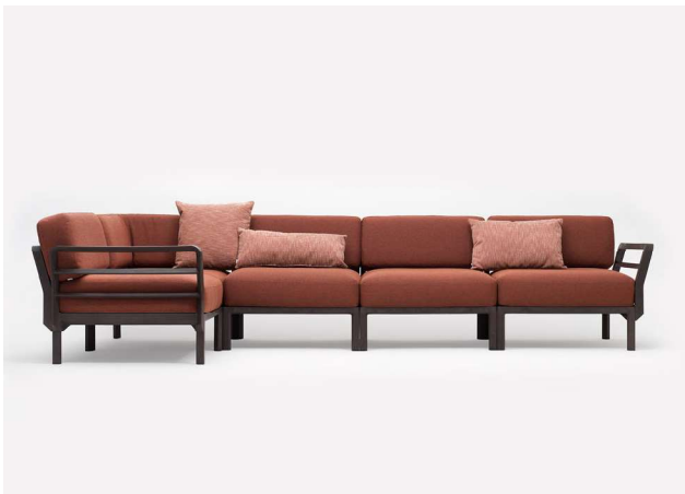
MAXIMO 5 terra / cannella Sunbrella®