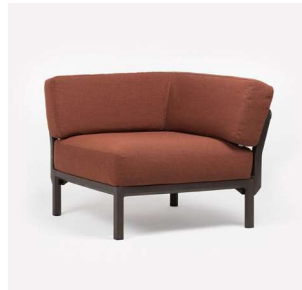
MAXIMO POUF MAXIMO ELEMENTO TERMINALE terra / cannella Sunbrella®