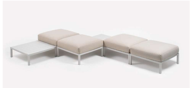
MAXIMO POUF gesso / perla Sunbrella® _ MAXIMO TAVOLINO gesso