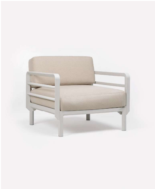
MAXIMO POLTRONA gesso / perla Sunbrella®