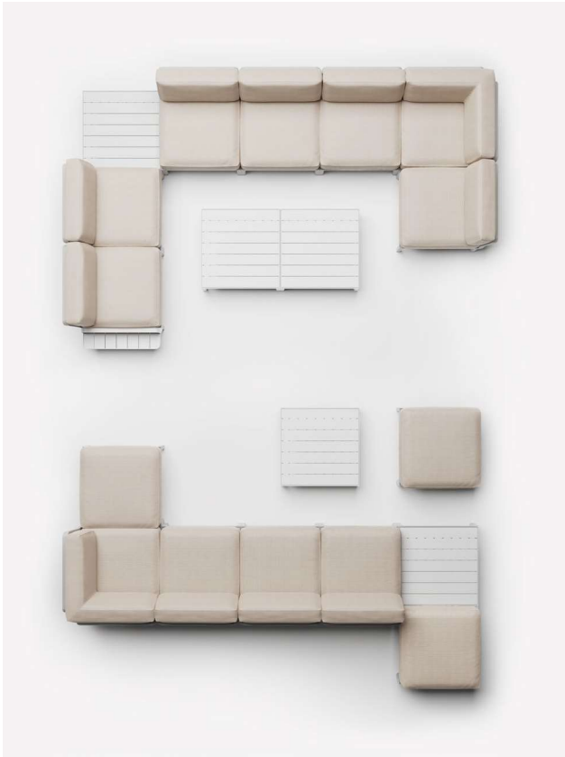
MAXIMO gesso / perla Sunbrella® _ MAXIMO PORTAOGGETTI _ MAXIMO TAVOLINO gesso