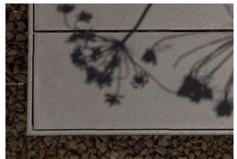
MAXIMO banaflo / Ivo Sumbrelli s.p.a. - MAXIMO tavolino banaflo

IL DESIGN SOBRIO E BILANCIATO DI MAXIMO SI SVILUPPA IN ORIZZONTALE, LA STRUTTURA È PIENA E RESA ESTETICAMENTE LEGGERA DALLA MODULAZIONE DELLE SEZIONI TRIANGOLARI E DAI DETTAGLI ARROTONDATI.