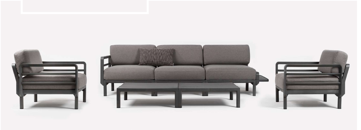
MAXIMO basalto / lava Sunbrella® _ MAXIMO PORTAOGGETTI _ MAXIMO TAVOLINO basalto