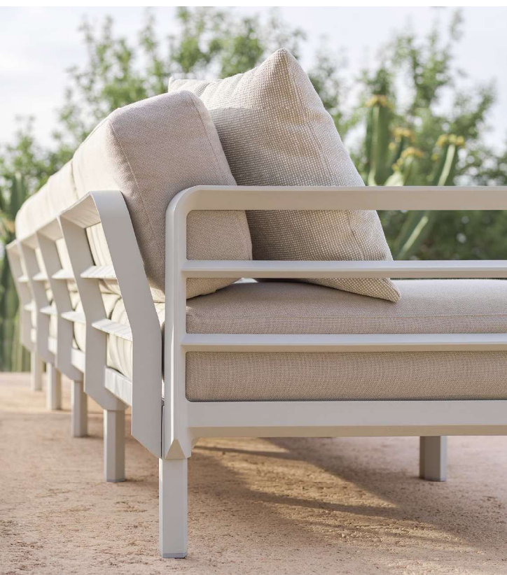
MAXIMO gesso / perla Sunbrella®