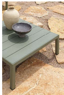
MAXIMO TAVOLINO cactus

THE MAXIMO COLLECTION ALSO INCLUDES A PRACTICAL ACCESSORY POCKET THAT CAN BE ATTACHED TO THE SEAT, AND A SLATTED LOW TABLE.