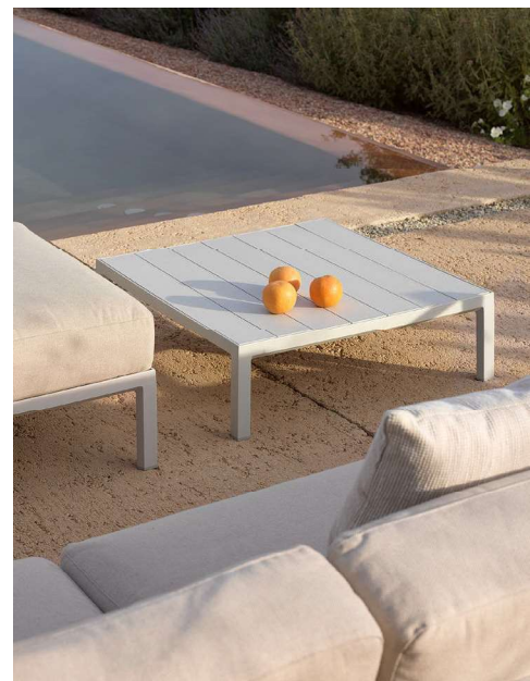
MAXIMO TAVOLINO gesso