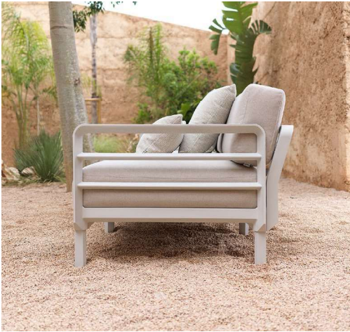
MAXIMO gesso / perla Sunbrella®