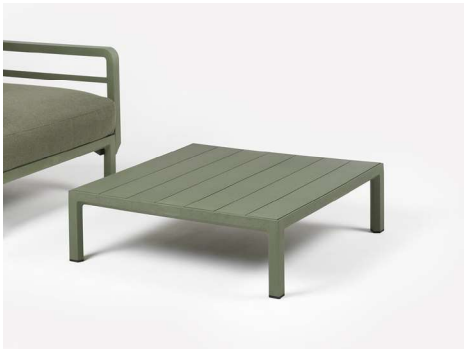
MAXIMO _ MAXIMO POLTRONA cactus / timo Sunbrella® _ MAXIMO TAVOLINO cactus