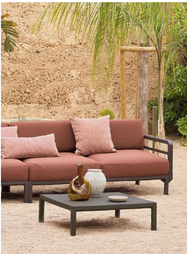
MAXIMO terra / cannella Sunbrella® _ MAXIMO TAVOLINO terra