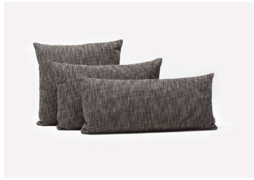
CUSCINO ARREDO MAXIMO 50x50 - 60x40 - 70x30 lava arredo Sunbrella®