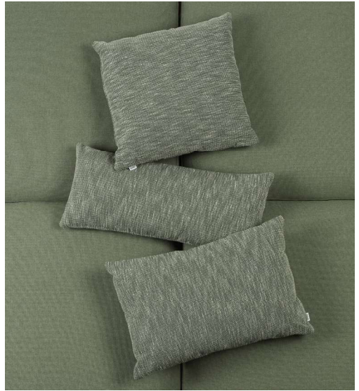
CUSCINO ARREDO MAXIMO 50x50 - 70x30 - 60x40 timo arredo Sunbrella®