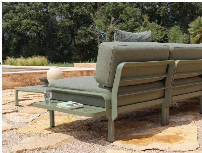
MAXIMO cactus / timo Sunbrella® - MAXIMO PORTAOGGETTI cactus

LA COLLEZIONE MAXIMO PREVEDE ANCHE UN PRATICO PORTA-OGGETTI AGGANCIABILE ALLA SEDUTA E UN TAVOLINO D'APPOGGIO DOGATO.