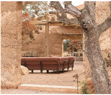
MAXIMO terra / cannella Sunbrella® _ MAXIMO TAVOLINO terra